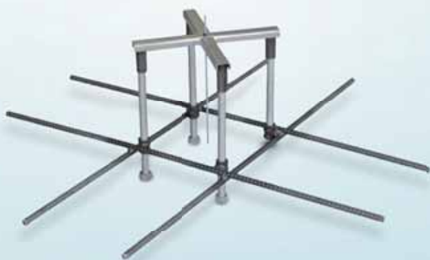
アンカーボルト打込フレーム