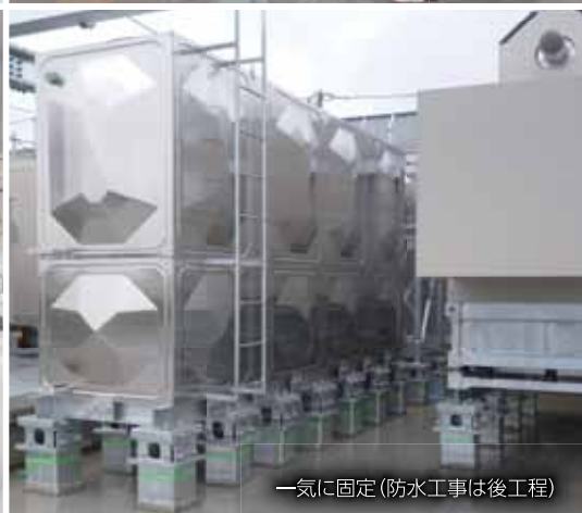
一気に固定(防水工事は後工程)