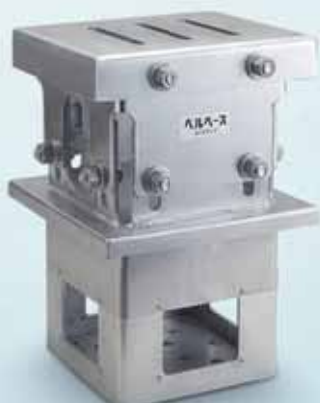
ベルベースA / 内アンカー